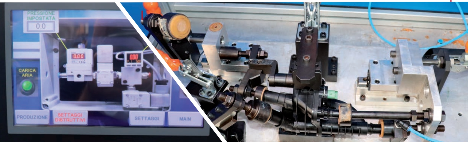
Test di controllo delle saldature

Non dimenticatevi! Original Birth , oltre le Flange Termostato offre una vasta gamma di prodotti: componenti per il sistema raffreddamento, sterzo e sospensione, supporti e tasselli motore, sospensione e cambio, cuffie semiassie e scatola sterzo, mozzi ruota, pedali, valvole EGR e tanti altri.