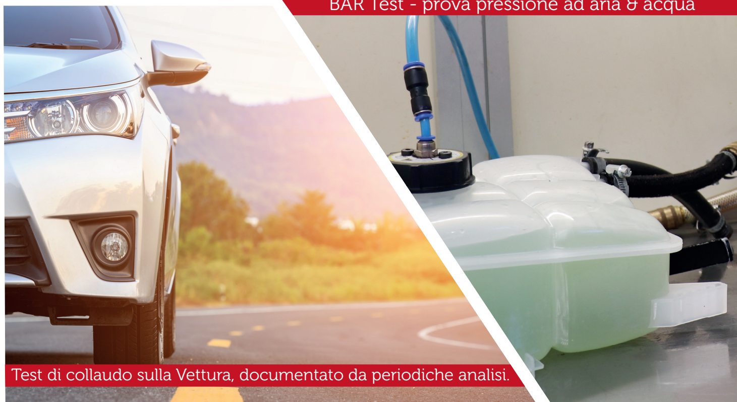
Test di collaudo sulla Vettura, documentato da periodiche analisi.

Non dimenticate! Original Birth , oltre ai vasi di espansione offre una vasta gamma di prodotti: componenti per il sistema di raffreddamento, sterzo, sospensione, supporti, tasselli per il motore, sospensione, cambio, cuffie, semiassie, scatola sterzo, mozzi ruota, pedali, valvole EGR e tanti altri.