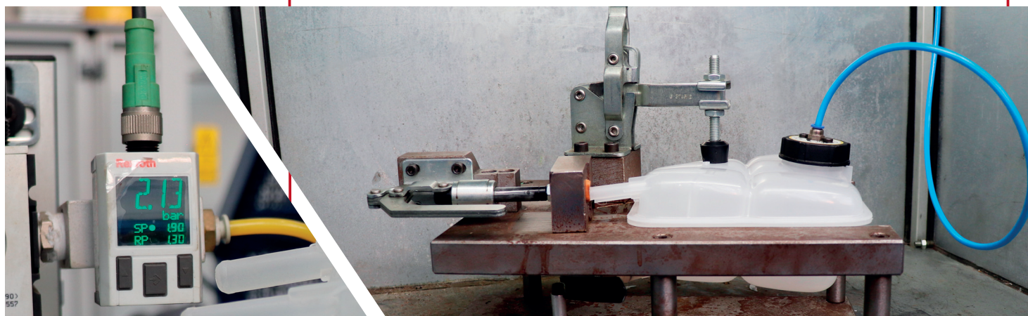
BAR Test - prova pressione ad aria & acqua