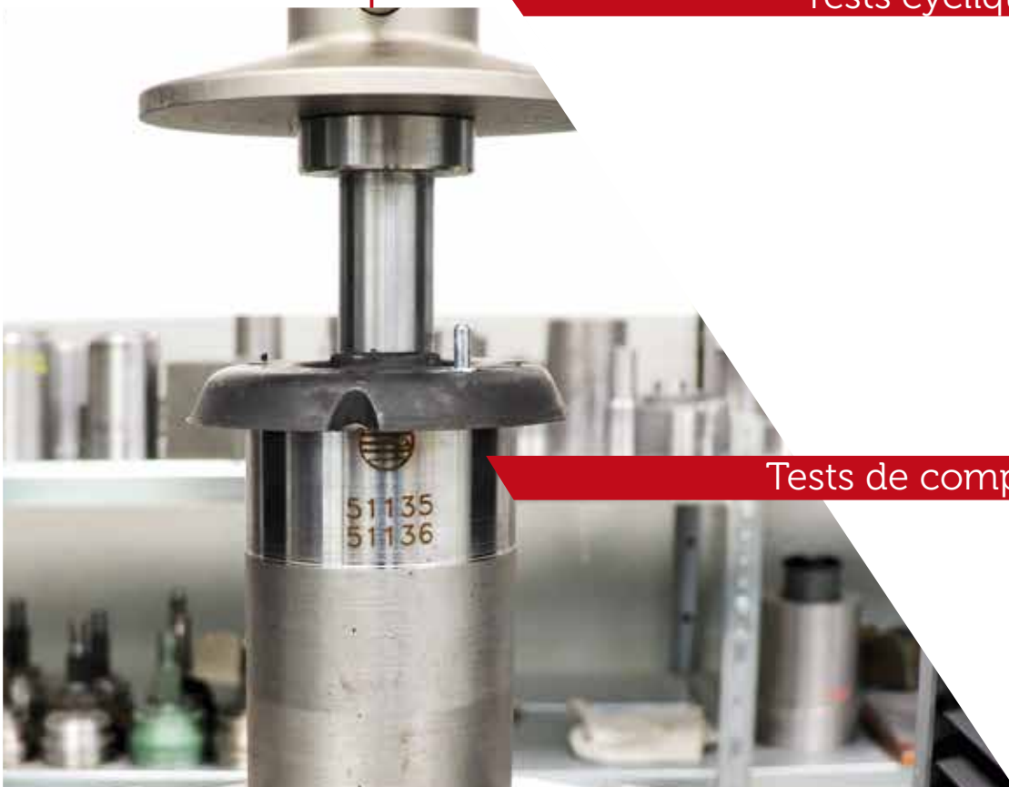
Tests de compression